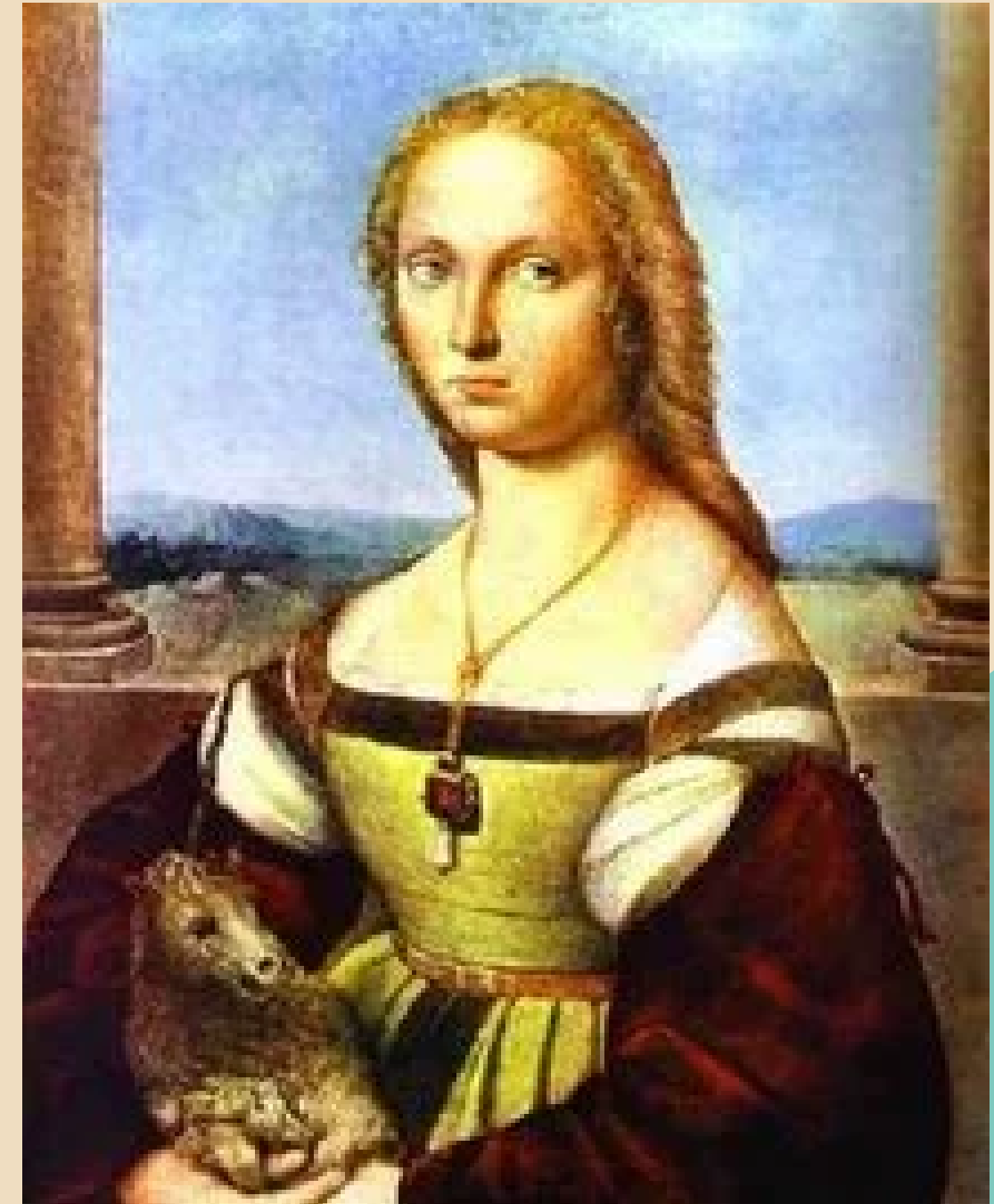
Dama del Unicornio Rafael Sanzio.