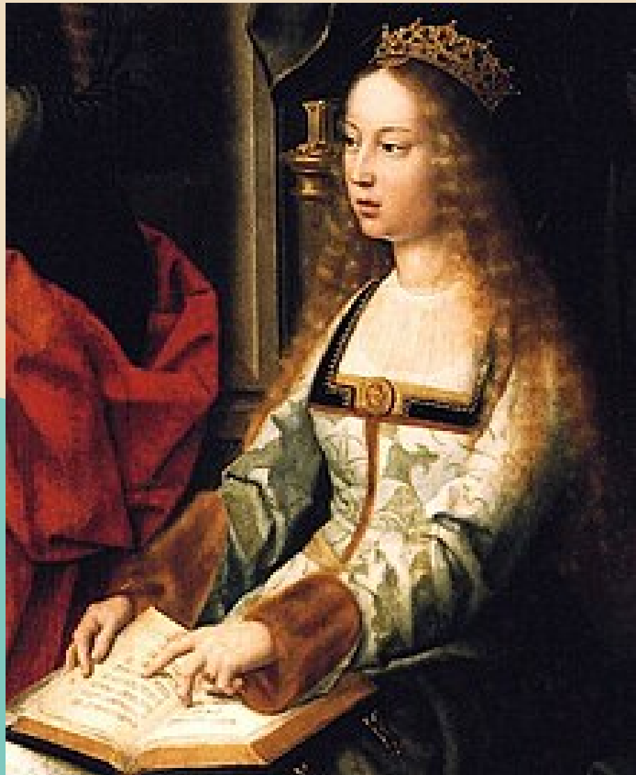
Isabel I de Castilla (Gérard David).