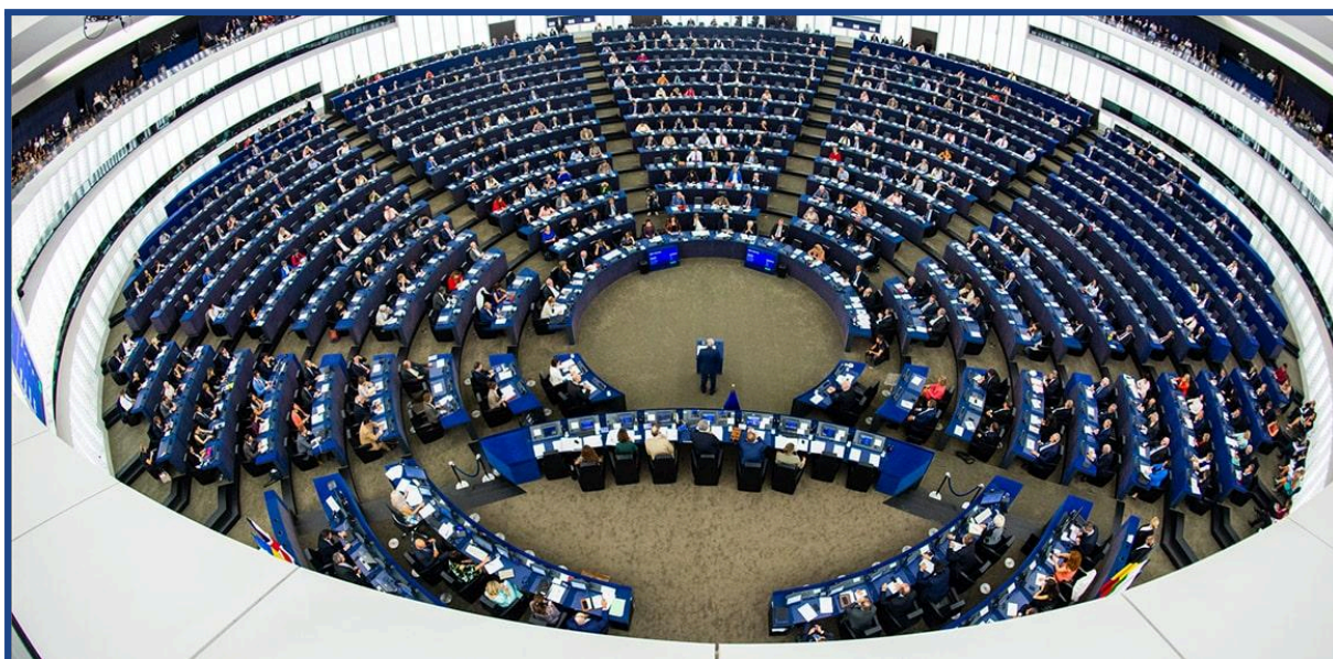
Vista del Parlamento Europeo reunido en Pleno junto a la Comisión Europea.

Cuantas más personas voten, más fuerte es la democracia.