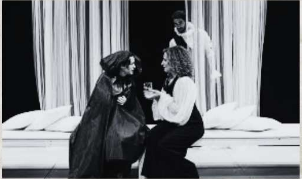
Representación de la obra Desengaños amorosos

Además, la autora fusiona el realismo social con elementos de horror y fatalidad, particularmente en Desengaños amorosos , donde las historias se sumergen en la brutalidad de la desilusión humana, con amores, pasiones y traiciones que terminan en sufrimiento y muerte. Esta visión no solo refleja la tragedia de sus personajes, sino también la crudeza de las escalas de poder que definían las relaciones entre hombres y mujeres.