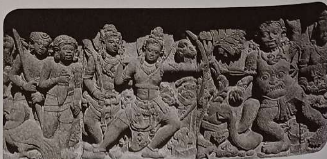
Relieve del Ramayana . Prambanan, Java.