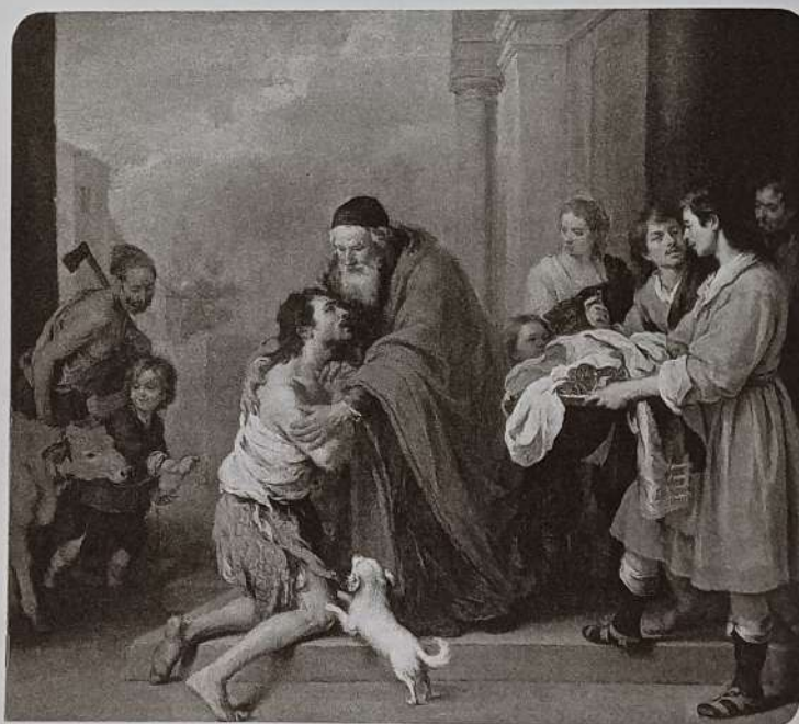
El regreso del hijo pródigo, óleo de Bartolomé Esteban Murillo. National Gallery of Art, Washington.